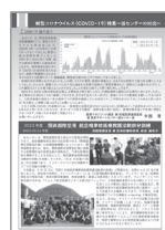
[p.4] 新型コロナウイルス (COVID-19)特集 ～当センターの対応～ /航空機事故医療救護活動部分訓練