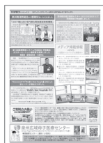
[p.7] 病院TOPICS 泉州南消防組合より感謝状/ 真皮縫合适正使用セミナー2023準優勝/第 15回医療教授システム学会総会・学術集会 ポスターセッション優秀賞/World's Best Hospitals 2023/メディア掲載情報/ご寄附の お願い/泉州広域母子医療センター