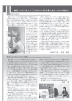
[p.4] 新型コロナウイルス (COVID-19)特集 ～当センターの対応～