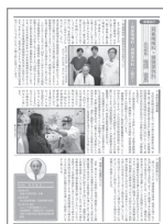
[p.5] 部署紹介-耳鼻咽喉科・頭頸部外科-