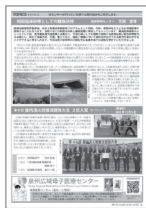
[p.6] 病院TOPICS 離島研修/屋内消火栓操法 競技大会入賞/泉州広域母子医療センター