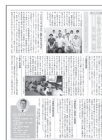
[p.5] 部署紹介-乳腺・内分泌外科-