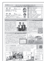
[p.7] 病院TOPICS 新入職員のご紹介/第118回 近畿血液学地方会優秀演題賞受賞/日本 動脈硬化学会第1回メディカルスタッフ賞受 賞/「超音波検査技術」優秀症例報告賞受 賞/七夕飾り/メディア掲載情報