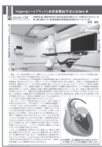
[p.3] Hybrid (ハイブリッド) 手術室開設予定のお知らせ～当センターの対応～