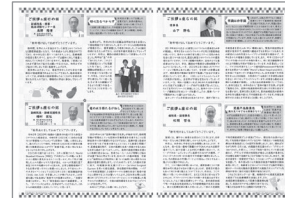
[p.2] ごあいさつ「座右の銘」 理事長:山下静也 病院長:松岡哲也 副病院長:鳥野隆博 副病院長:種村匡弘