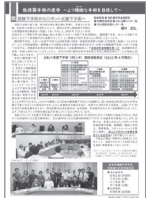
[p.2] 低侵襲手術の進歩 ～より精緻な手術を目指して～