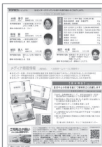
[p.7] /新入職員のご紹介/メディア掲載情報/【基本理念】【基本方針】/ご寄附のお願い