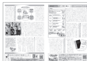
[p.2] 認知症ケアセンターの取り組み