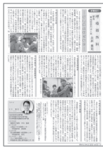
[p.4] 部署紹介-呼吸器外科-