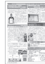
[p.7] 病院TOPICS 瑞宝双光章 受章/感謝状・功労賞 受賞/学会受賞/新入職員紹介/糖尿病フェスタ/メディア掲載情報